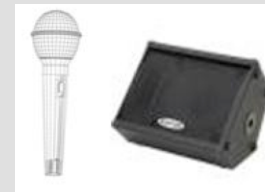
Monitor / Lead Voc m