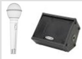
Monitor / Back Voc.