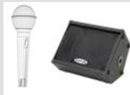
Monitor / Lead Voc f